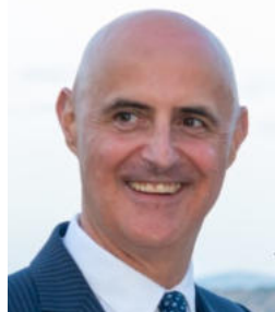
Guillaume Émile-Zola-Place Président